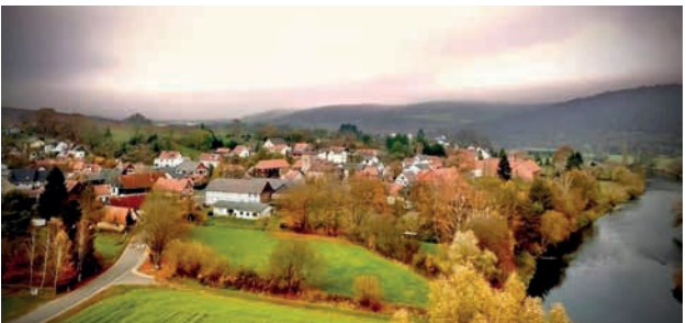
Blickershausen von oben