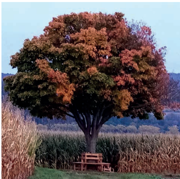
Baum an einem Feldweg, wo man ideal wandern kann und die Bank zum Ausruhen einläd.