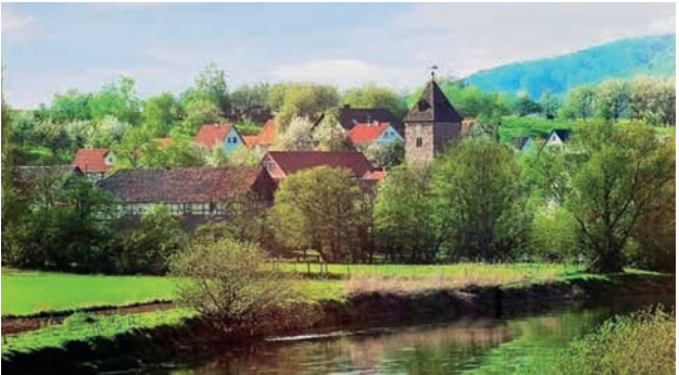
Blickershausen an der Werra

Der kleine Ort Blickershausen bietet zahlreiche Möglichkeiten zum Wandern, wo man an den Wochenenden zu Kaffee und Kuchen einkehren kann.