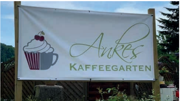
Ankes Kaffeegarten am Radweg